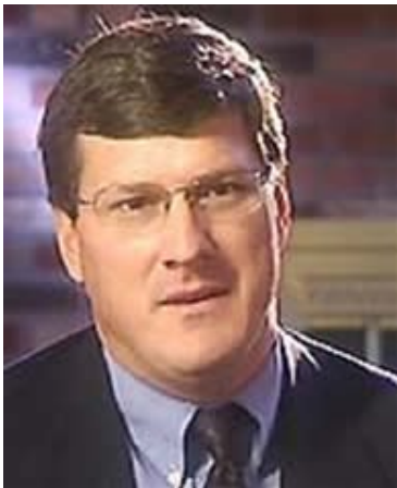
Ταγ/χης Σκοτ Ρίτερ

Ο Πλοίαρχος Φίλιππος είναι απόφοιτος της Ναυτικής Ακαδημίας των Η.Π.Α. ο οποίος στη διάρκεια της 23-χρονης υπηρεσίας του στο ναυτικό έχει απονεμηθεί την Λεγεώνα της Αξίας, το Μετάλλιο Αξιόπαινων Υπηρεσιών Αμύνης, τρία Μετάλλια Αξιόπαινης Υπηρεσίας, το Μετάλλιο Επαίνου Μικτής Υπηρεσίας, δύο Μετάλλια Επαίνου του Ναυτικού και το Μετάλλιο Επιτεύγματος Ναυτικού.