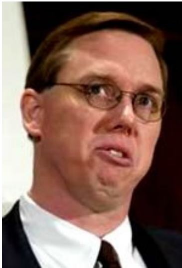
Ρόμπερτ Γκ. Ράιτ ο νεότερος

Παρά τις υψηλού προφίλ αποκαλύψεις της πράκτορας Ράουλεϊ και την οικεία γνώση των προσπαθειών της έδρας του FBI να εμποδίσει τις έρευνες για τις σχετιζόμενες με την Αλ Κάιντα τρομοκρατικές δραστηριότητες κατά τις τέσσερις εβδομάδες πριν από την 11/9, η Επιτροπή 11/9 δεν της πήρε ποτέ κατάθεση. Ο «πλήρης και τέλειος απολογισμός των περιστάσεων που περιβάλλουν τις τρομοκρατικές επιθέσεις της 11ης Σεπτεμβρίου 2001» της Επιτροπής 11/9 δεν περιέχει καμία αναφορά των ισχυρισμών της κατά τους οποίους η έδρα του FBI «που συνέχισε, σχεδόν ανεξήγητα, να στήνει εμπόδια και να υπονομεύει» τις αντιτρομοκρατικές προσπάθειες πρακτόρων του FBI στο πεδίο. Η έκθεση της Επιτροπής 11/9 μόνο πλαγίως αναφέρει την πράκτορα Ράουλι σε μια και μόνο υποσημείωση.