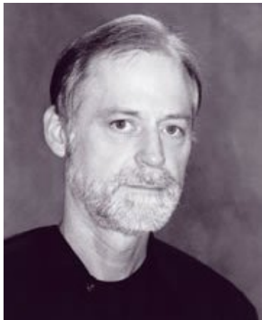
Ταγ/χης Τζον Νιούμαν

«Η Επιτροπή 11/9 η οποία μελέτησε την απόδοση της κοινότητας των Αμερικανικών μυστικών υπηρεσιών και των σωμάτων επιβολής του νόμου με μεγάλη λεπτομέρεια (ίσως όχι και σε τόση μεγάλη λεπτομέρεια αλλά το έκαναν) αμέλησε να καλύψει την απόδοση της κοινότητας στις εβδομάδες αμέσως μετά τις επιθέσεις για να καθορίσουν ποιος ευθυνόταν γι αυτές. Δεν υπάρχει λέξη γι αυτό στην αναφορά.