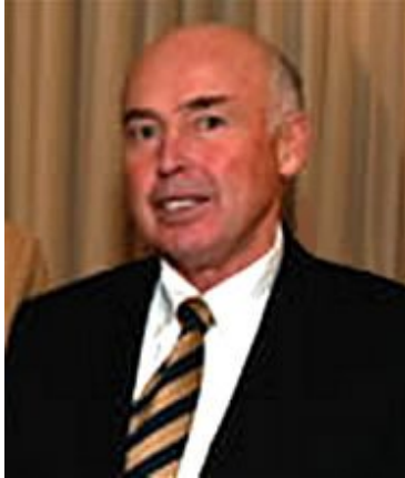
Δρ. Άντζελο Κοντεβίλλα

διαπράξουν εθελούσια και ταυτόχρονη αυτοκτονία. Τα στοιχεία δεν ευσταθούν. Η επίσημη ιστορία δεν πείθει επειδή δεν εξηγεί τα αληθινά θέματα της πολυπλοκότητας». 2 Τις επιφυλάξεις του κ. Άρνολντ για την πτώση των πύργων του Παγκόσμιου Κέντρου Εμπορίου συμμαρτίζεται ο Ουίλιαμ Κρίστινσον, τέως Διευθυντής Περιφερειακής και Πολιτικής Ανάλυσης στη CIA και άλλων όπως εξηγείται παρακάτω.