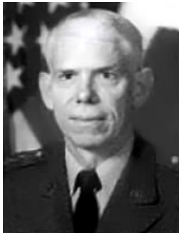
Υποστρ/γος Άλμπερτ Σταμπλμπαϊν

Υποστρ/γος Άλμπερτ Στάμπλμπαϊν , Αμερικανικού Στρατού (εν αποστρ.), πρώην Διοικητής της Αμερικανικής Διοίκησης Στρατιωτικής Κατασκοπείας και Ασφάλειας (INSCOM), δεινός επικριτής της επίσημης εκδοχής των γεγονότων της 11/9. Στο βίντεο ντοκιμαντέρ του 2006 Ένα Έθνος Υπό Πολιορκία είπε «Μια από τις εμπειρίες μου στον Στρατό ήταν ως επικεφαλής της Ερμηνείας Φωτογραφιών για Επιστημονική και Τεχνική Κατασκοπεία του Στρατού την εποχή του Ψυχρού Πολέμου. Έπαιρνα τα μέτρα κομματιών Σοβιετικού εξοπλισμού από φωτογραφίες. Ήταν η δουλειά μου. Κοιτάζω την τρύπα στο πλευρό του Πενταγώνου και κοιτάζω το μέγεθος ενός αεροσκάφους που υποτίθεται ότι χτύπησε το Πεντάγωνο και λέω 'Το αεροπλάνο δεν χωράει μέσα σε αυτή την τρύπα.' Οπότε τι χτύπησε το Πεντάγωνο; Τι το χτύπησε; Που είναι; Τι συμβαίνει εδώ;» 36