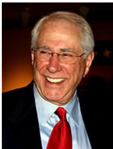
Γερουσιαστής Μάικ Γκράβελ

Μόρτον Γκούλντερ (1921 – 2008) διορίστηκε Αναπληρωματικός Βοηθός Υπουργός Αμύνης για θέματα Κατασκοπείας και Προειδοποίησης υπό τον Πρόεδρο Ρίτσαρντ Νίξον και συνέχισε με αυτή την ιδιότητα υπό τους προέδρους Τζέραλντ Φορντ και Τζίμι Κάρτερ. Κατά την διάρκεια του Δευτέρου Παγκοσμίου Πολέμου υπηρέτησε ως Πλωτάρχης στο Ναυτικό των Η.Π.Α. Υπήρξε συνιδρυτής της μεγάλης στρατιωτικής βιομηχανίας Sanders Associates.