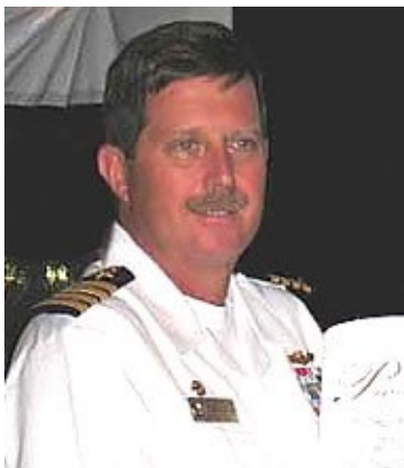
Πλοίαρχος Σκοτ Τζ. Φιλποτ

«Μετά την επαφή με δυο διαφορετικά μέλη της ομάδας ABLE DANGER ... το προσωπικό της Επιτροπής 11/9 αρνήθηκε να διεξάγει σε βάθος ανάλυση ή έρευνα των θεμάτων που τους έγιναν γνωστά. ... Ήταν χρέος τους να ερευνήσουν εξονυχιστικά αυτούς τους ισχυρισμούς – όχι απλά να τους απορρίψουν βάσει αυτού που πολλοί τώρα πιστεύουν ότι ήταν ένα προπαρασκευασμένο συμπέρασμα στην ιστορία της 11/9 που ήθελαν να πούνε. ... Την θεωρώ αυτή μια αποτυχία του προσωπικού της Επιτροπής 11/9 – μια αποτυχία της οποίας οι ίδιοι οι επίτροποι έπεσαν θύματα – και συνεχίζει να διαπράττεται πάνω τους από το προσωπικό όπως διαφαίνεται από το πρόσφατο αβάσιμο συμπέρασμα ότι τα ευρήματα του ABLE DANGER ήταν 'αστικοί μύθοι'.» 41