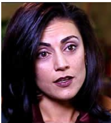
Sibel D. Edmonds

„Po przeczytaniu raportu Komisji muszę stwierdzić, że jest on niekompletny. Pominięte zostały bardzo ważne dane wywiadowcze, o których sama jako świadek Komisję informowałam, a które zostały później potwierdzone. Dlatego też uważam, że są i inne informacje, o których nie wiem, a które zostały pominięte w waszym raporcie. Ominięcia te rzucają cień na ważność raportu oraz zawarte w nim konkluzje i rekomendacje.” 26