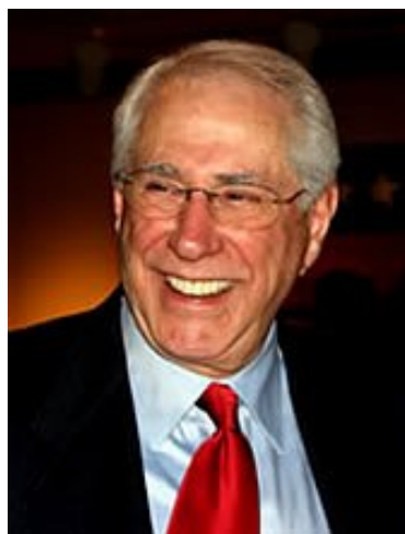
Senator Mike Gravel