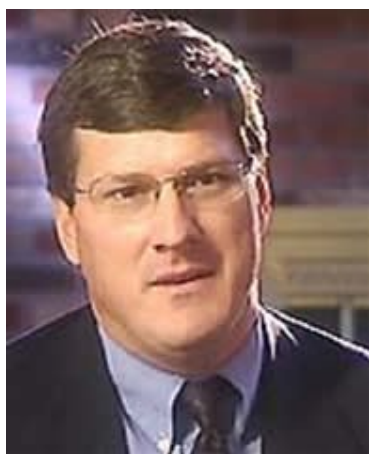
Maj. Scott Ritter